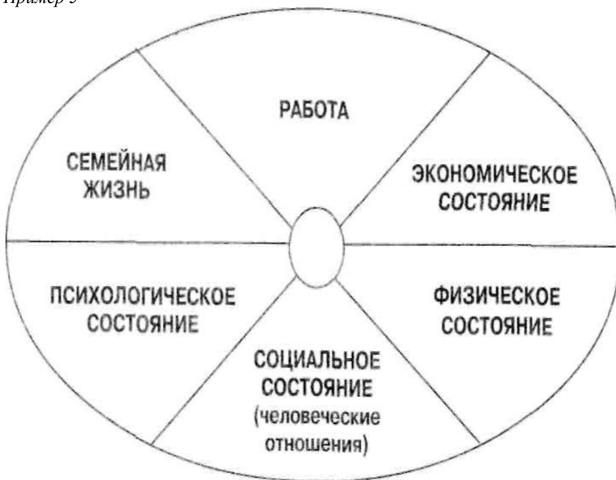
Рисунок 2.1.1 – Примерная структура личного жизненного плана карьеры руководителя